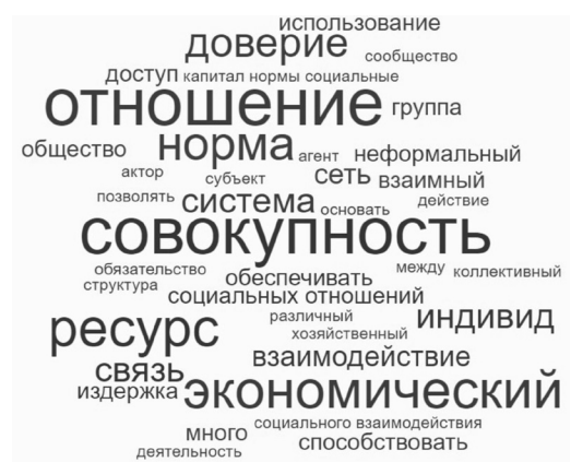
Рис. 1. Облако слов на основе определений социального капитала.

Данная авторская синтетическая формулировка определяет социальный капитал как достояние и ресурс, одну из многочисленных характеристик общества, определяющих ход социально-экономического развития. Социальный капитал представляет собой инструмент для продвижения индивидами и социальными группами своих интересов с целью получения материальных и нематериальных