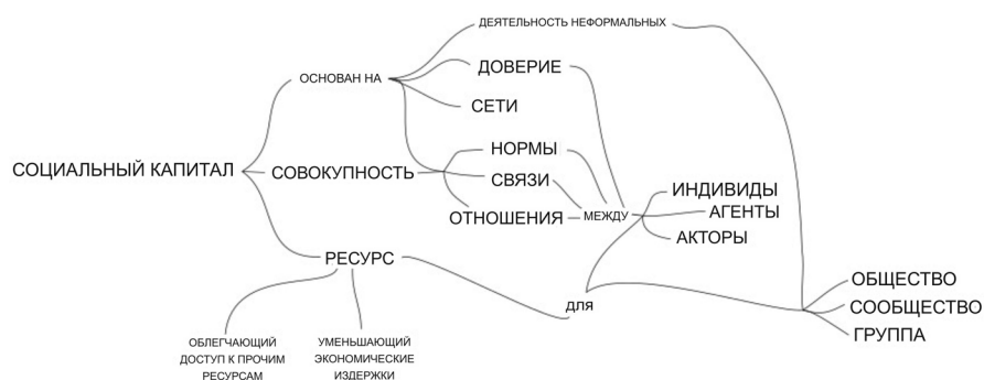
Рис. 2. Семантическая сеть понятия «социальный капитал».