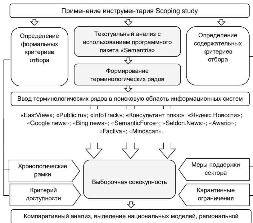
Рис. 1. Системно-критериальный подход к анализу официальных документов и новостных публикаций. Составлено авторами.

Полученные результаты. Для анализа введенных мер поддержки туристского сектора нами была сформирована выборочная совокупность англоязычных (2365 единиц) и русскоязычных (971 единица) новостных публикаций и документов.